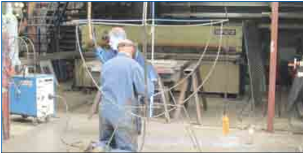
Het in elkaar lassen van het geraamte van de vis voor Keep it Clean day